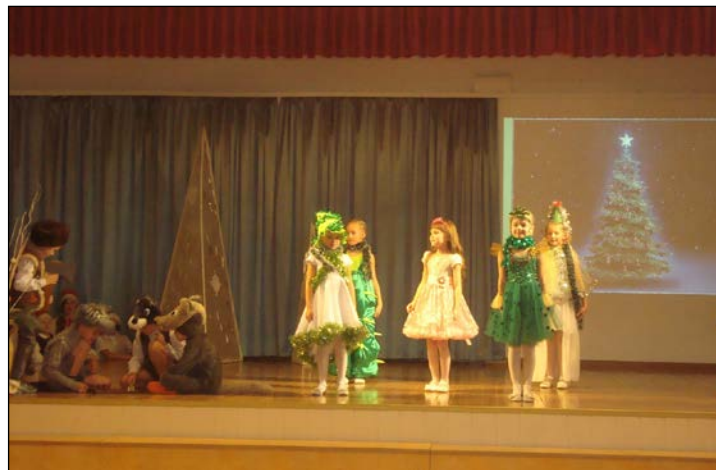
1А класс радует всех своим выступлением