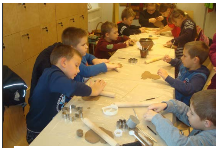
1В класс в Науенском музее