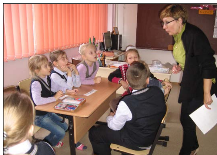
1.C klase spēlē "Mana pilsēta"